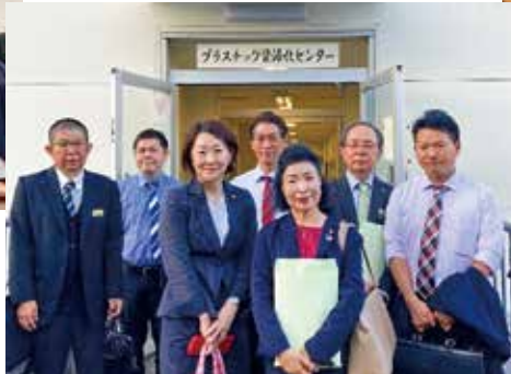
戸吹クリーンセンター (東京都八王子市)