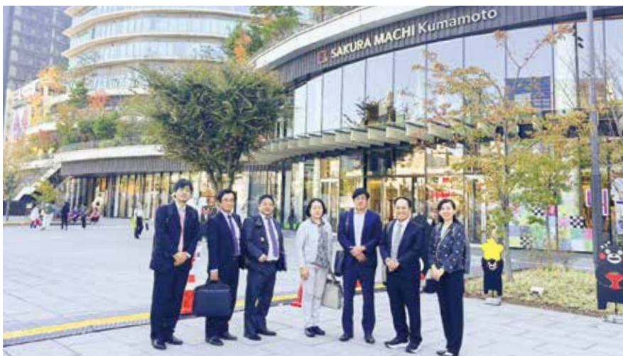
総務財政常任委員会:サクラマチクマモト(熊本県熊本市)にて