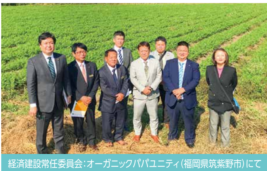
経済建設常任委員会:オーガニックパユニティ(福岡県筑紫野市)にて