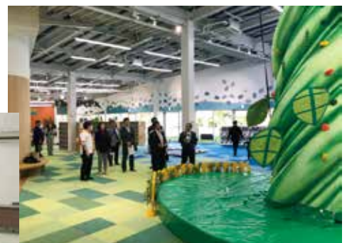
佐世保中央公園(長崎県佐世保市)