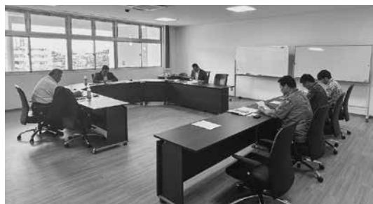
福岡県春日市議会（会派翔春会及び議長）