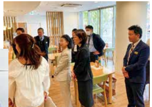
特定非営利活動法人ドリームタウン 「ななテラス」(東京都板橋区)