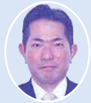
山川 仁 議員