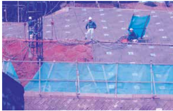
工事が進む市道 175号線 豊見城ニュータウン地内

問 市道175号線は豊見城ニュータウン地内の路線です。防災・安全社会資本整備交付金事業の平成27年度事業内容について伺う。