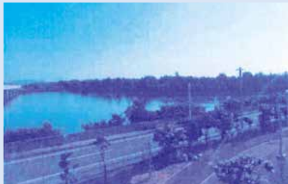
開発が進められるゴルフ場跡地

水産業の育成について 軽量型漁礁について当局は漁民に対してこれまでどのような調査・研究を行ったのか、今後の取り組みについて伺います。