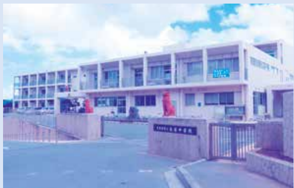
伸び伸びと学べる学校に

問 子どもの貧困が 今、社会問題にな り、その対策は国・県・ 市を挙げて取り組んでい ます。就学援助金につい て、対象となる収入、所 得を生活保護基準の1.3倍