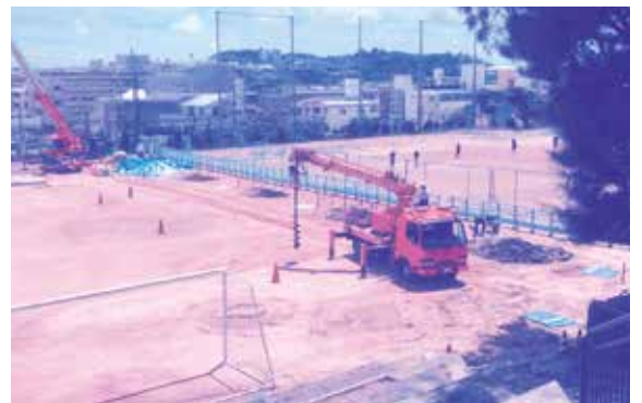
新庁舎建設と豊見城中学校改築が始まります

中学校改築事業予算確保の目途が立った。改築スケジュールは、現在は平成27年度から繰り越している基本設計の中で配置計画の検討を行っている。工事は上田小の完成予定年度である平成30年度から着手する計画ですが、学校運営上の影響を考慮し、早期に着手し、短期間で完成するように検討を重ねている。なお、改築事業の実施には、しばらくの間ご不便をおかけしますが、先生方、生徒、父母を含めた地域の皆さんの協力なくして進めることはできません。