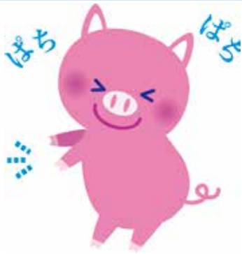
関係者のご理解ご協力に感謝

総務課長 地域の人的防災力が上がることから、防災士の養成は有効な手段と考えております。資格取得に向けた支援ですが、まずは県内の研修開催について、防災士研修センターに協力を求め、資格取得への助成については、