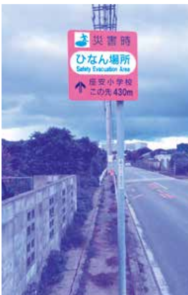
ひなん場所 たどり着くやら 着けぬやら