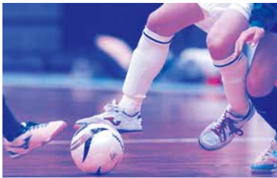
学校体育館でフットサルの再開を!!