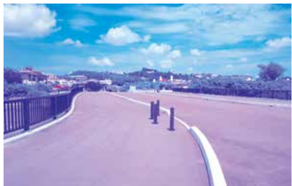
県補助金の削減で事業の遅れる市道257号線、203号線

ノルール関連や街路事業が最終年度のを優先している」と聞く。その影響は予定していた用地取得できず、事業が遅れが生じる。都市公園安全安心対策事業の減額影響は、28年度予定をしていたニュータウン第2公園の遊戯施設、しおさい公園の東屋4基、しらゆり児童公園、たんぼ児童公園の屋外トイレの工事が翌年度以降に先送りとなる。④県の補正増額等の機会があれば積極的に要望し、事業遂行を図っていききたい。