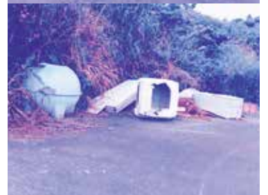
不法投棄された電化製品 (保栄茂後原)