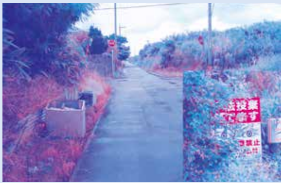
不法投棄はやめましょう