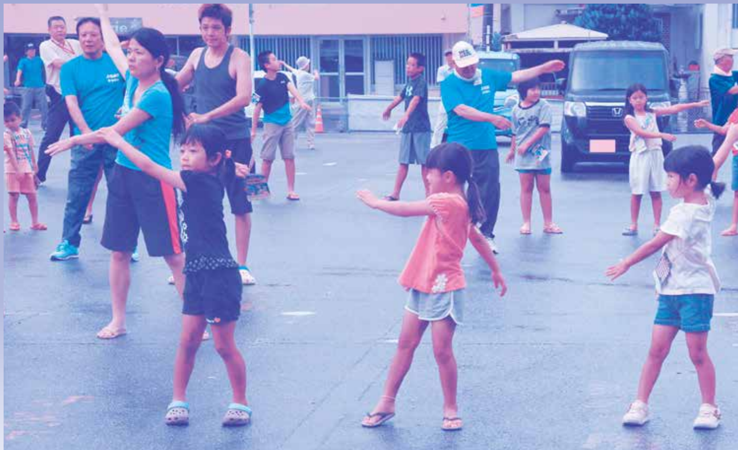
▲上田山川自治会ラジオ体操