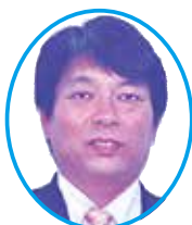
外間 剛 議員