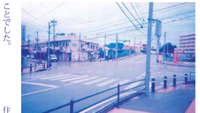
豊見城初のスクランブル交差点を目指して…

式への変更について、豊見城警察署へ確認したところ、スクランブル方式に変更するためには、歩行者数が多いことや地域からの強い要望が必要である。スクランブル方式の場合は、歩行者及び車両の信号待ち時間が増えることにより、運転者に与える影響を考えると、現状ではスクランブル方式への変更は厳しいとの