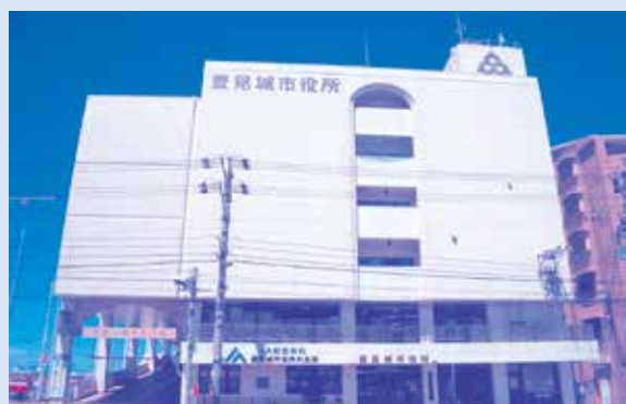
数々の不祥事、大改革が求められる