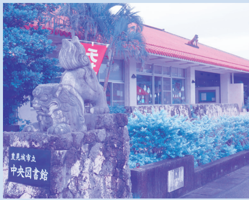
司書がすべて臨時の中央図書館

運用の実績はございません。導入に向けて現在、検討中です。 問 字公民館支援について伺います。一括交付金を活用しての字公民館建設支援が県内各地で行われていますが、そ