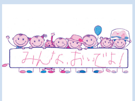
子どもたちの未来を開く確かな一歩を!!