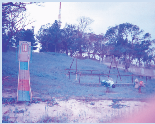
再整備が必要な根差部児童公園

平成25年8月13日、第1回、平成27年2月18日第2回、平成27年11月17日第3回根差部児童公園意見交換会をし、自治会の考え方を市の考え方が示されました。自治会からは土地の無償賃貸契約を更新しない、と及び土地の買い上げ要求をした。そこで、根差部児童公園の整備事