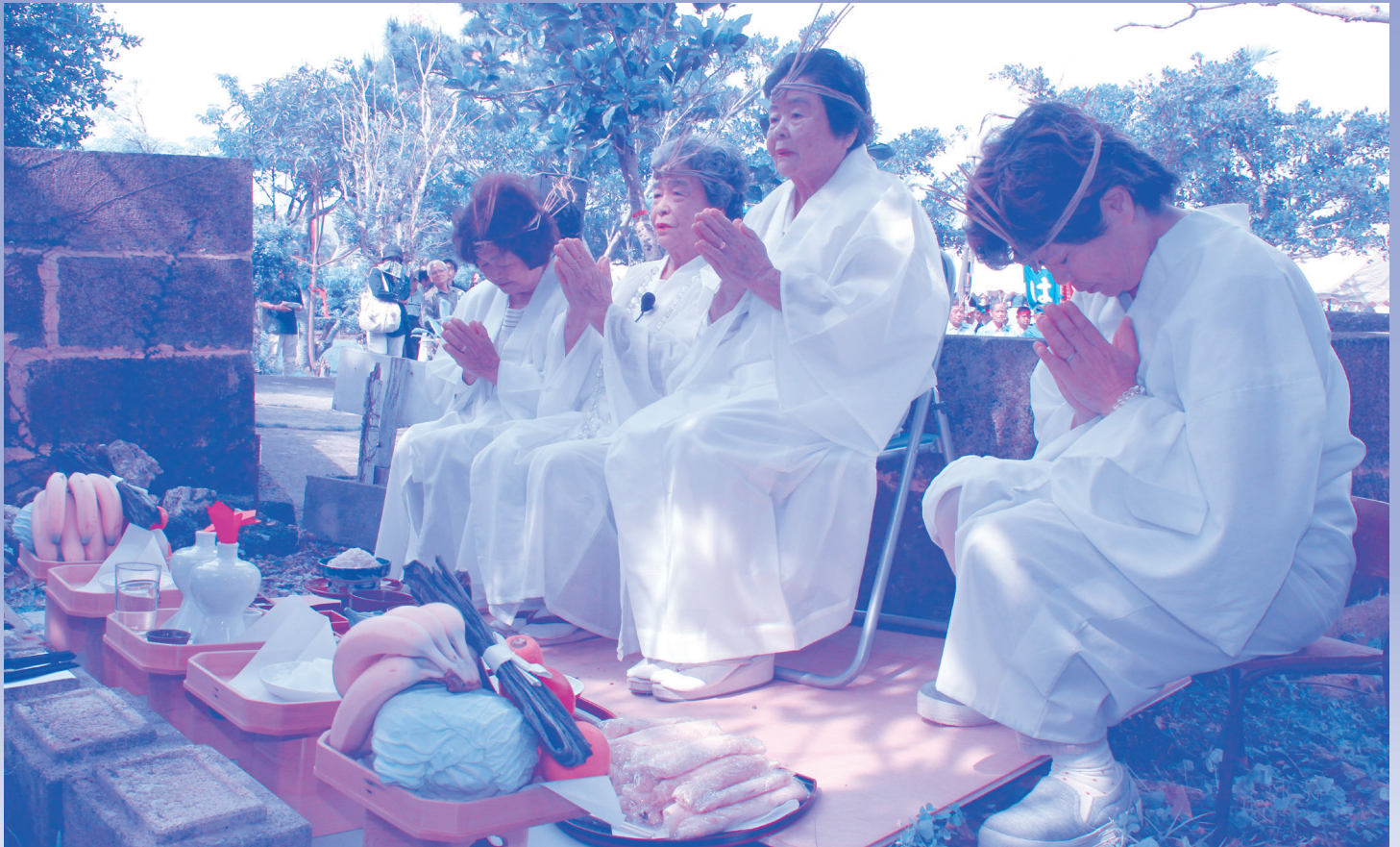
▲豊見瀬嶽前で行われた第14回ハーリー由来まつり