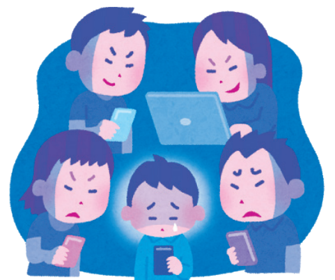
SNSの危険性・いじめ未然防止策は？

答 学校施設課長 (ア)教育委員会としては保護者への説明を行っておりますが今後学校と調整し保護者へ説明を検討したいと考えています。(イ)代替施設の確保を行い部活動への影響が最小限となるよう取り組んでいきたいと考えております。