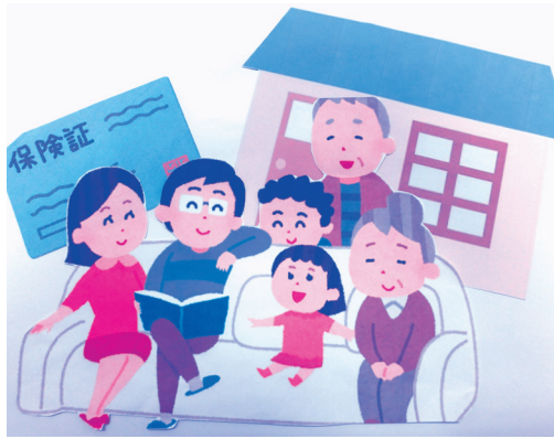
平成30年度県広域化へ向けた国保の見直し!!

はとても大切なことです。ただ、短期証に頼った徴収率アップというだけではなく、やはり納付意識を高めていくということが本場の意味での徴収率のアップ