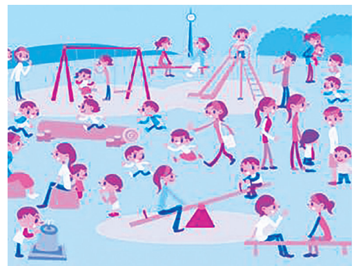
市街化調整区域の子どもたちにも児童公園は必要