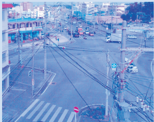
新庁舎を中心とした「まちなみ顔づくり」が始まります。都市施設課担当の饒波川線の進捗は、ゆたか小の子ども達が安全安心に通学できる道路環境の期待もあることから当路線の早期供用開始に向け取組んでいる。公園事業は28年度、緑の基本計画改定の際に都市公園中長期整備計画に盛り込み、国庫補助採択後に中心市街地公園緑地整備を行う。

①庁舎建設事業は平成27年6月より基本設計及び実施設計を進めており、3月初旬で基本設計は完了、現在実施設計を進めている。今後は地区計画届出と建築確認申請協議を行い、4月より開発行為、赤土対策等