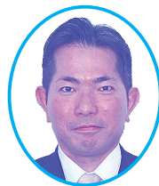
山川 仁 議員