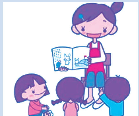
広げよう子育て支援の輪