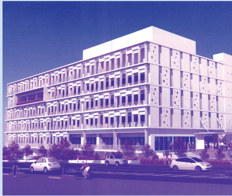
市民待望の新庁舎が今年夏頃着工予定(上田交差点)

答 福祉部長 待機児 童解消に向けた 諸施策として認 可保育所の増築 を1園、小規模 保育園の新設の 2園で2億1千 88万6千円。事 業所内保育総合