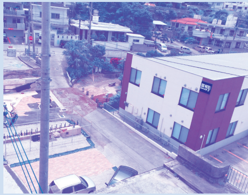
早期開通が待ち望まれる万人橋

答 経済建設部長 平成27年度は旧橋梁の取り壊しと新しい橋の一部施工を行っており、平成28年度には市選出の新田県議のご尽力により予算確保ができたため、新しい橋が完成でき