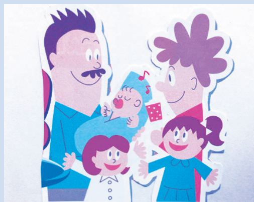
子どもが活きる街