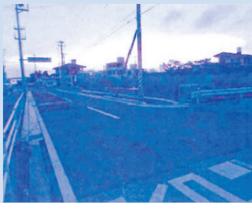
改善を必要とする交差点

答 経済建設部長 市道10号線及び市道216号線の道路整備におきましては、非常に危険であることから、十字