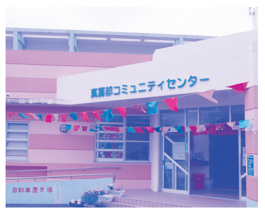
子どもの支援事業を担う真嘉部コミュニティセンター

答 ひとり親世帯の 支援にクラブによ っては独自努力で保育料 を助成している。市独自 に、それに値する額は市 が助成すべきでないか。