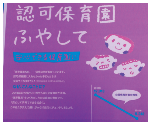
公立保育所が全国で減らされた