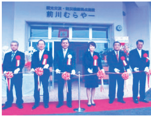
交流施設で地域活性化を目指そう!!