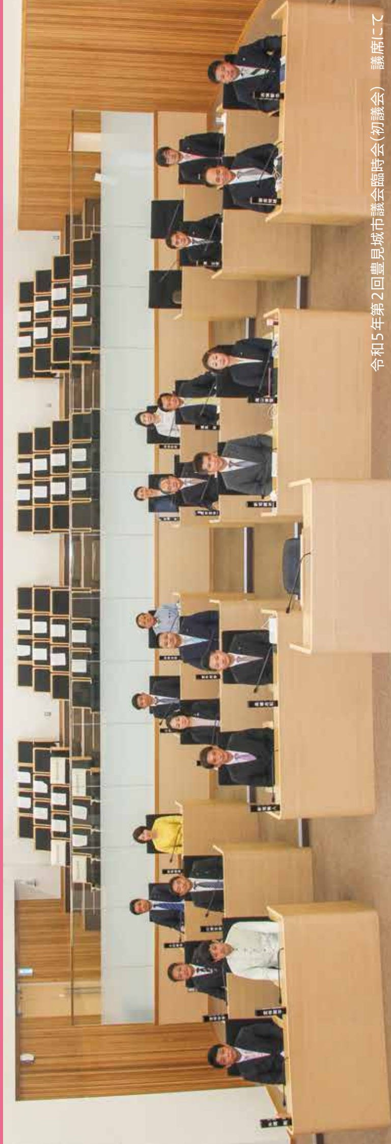
令和5年第2回豊見城市議会臨時会(初議会) 議席にて