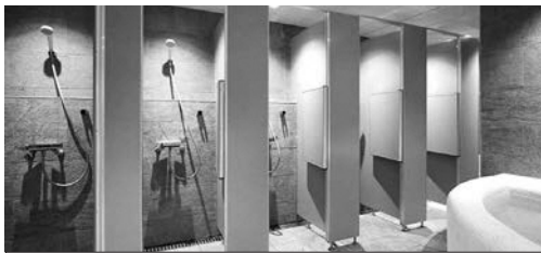
市民のためにもハイクオリティーを提供しましょう!!