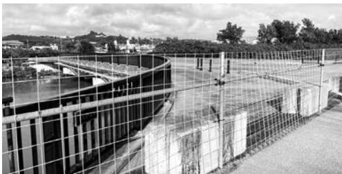
豊崎小学校と翁長地域を繋ぐ翁長橋! 開通間近!

経済建設部長 今年度中に翁長橋と市道203号線の交差点付近用地売買契約が締結できるよう地権者と最終的な協議を行っている。令和3年度当初予算に交差点部分の工事に係る予算を計上し、土地売買契約と関係機関協議が完了次第工事を発注する計画。