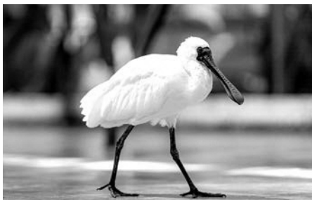
観光・環境の観点から市の鳥に制定すべき!

総務企画部長 貴重なクロツラヘラサギが継続して確認されるよう湿地の環境状況の把握や清掃活動等を引き続き行いながら関係団体とも意見交換を行い、制定に対する市民等の機運が高まることも重要な観点であるので検討をしていきたい。