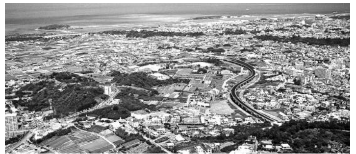
しっかりしたゾーニングでスプロール現象に歯止めを

総務企画部長 お互いの産業連関を高め、お互いの産業振興に資する構造を作り出すためには、多くの観点からの検討が必要となる。市民が生活している場で仕事ができる、市民が豊かになる産業構造を創るためにはどういった産業が必要なのか、またどこに必要なのかということに関し、各種統計調査のデータ等の収集分析、各課の産業振興施策の取組状況の把握、分析、市内事業者へのニーズ調査などを取り組み、推進していきたい。