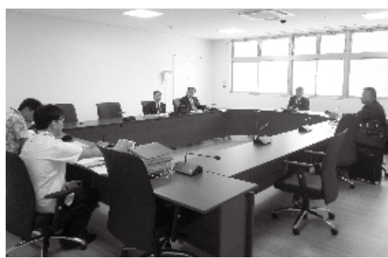
静岡県御殿場市議会(会派「改新」)

毎年、全国各地の議会から、本市の取り組み状況や市内の関連施設について、視察に訪れます。なお、視察の際には議長、議会事務局、各関係課等で対応し説明を行っております。