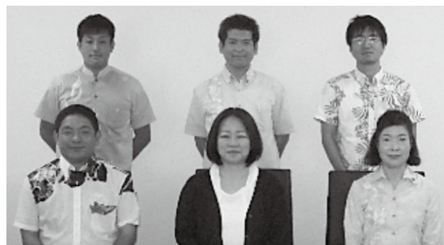
議会だより調査特別委員会