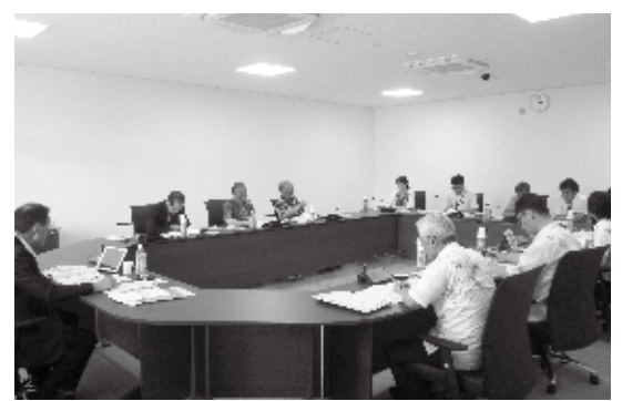
山形県鶴岡市議会(厚生常任委員会)