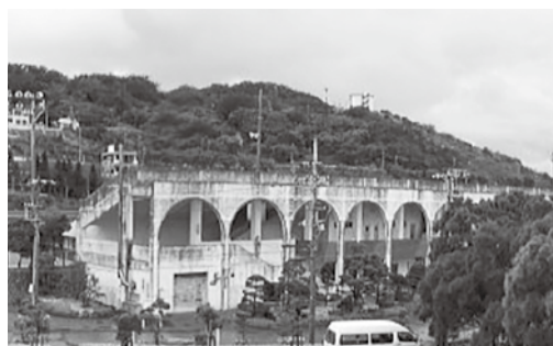
老朽化した施設ではアスリート合宿は呼び込めない