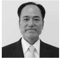
日本共産党 瀬長 恒雄