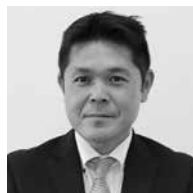
真新会 要 正悟