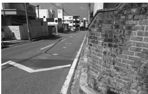
通学路における児童の安全確保は、道路行政の基

経済建設部長 字渡橋名37番地付近につきましては、一部区間において歩道が設置されていませんので、予算面も含めて検討を行い、現在進められている市道25号線整備事業の延伸として事業が可能かどうか、沖縄県と調整を図りながら検討していきたいと考えています。