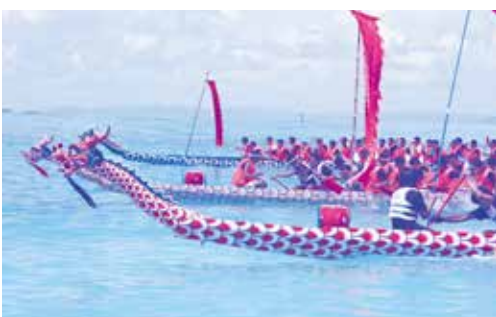
新たに高校生のパワーを加入させて活性化を！！

総務課長 公園等の指定緊急避難場所についても、避難所が開設されるまでの間、最低限の整備は必要なので、継続して利用できるよう、施設管理担当部署と連携し、検討していく。