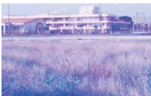
ここに津波避難機能備えた学校造ろう