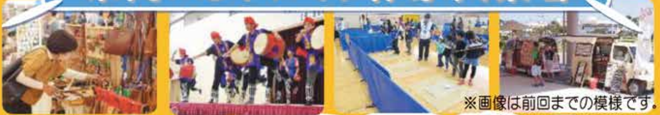
※画像は前回までの模様です。