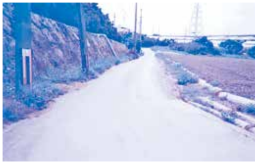
市道33号線（饒波）の早急な整備を！

経済建設部長 市道33号線について、現場を確認したところ、亀裂やでこぼこがあり、状態が悪い状況でした。計画的に部分的な修繕を行い、安心安全な利用ができるよう進めてまいります。