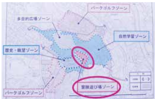
長嶺城址公園の早期実現

都市計画部長 本市で進行中の区画整理事業としては、公共団体施行として本市が施行しているものが2地区、それから組合や個人による民間施行が2地区です。現在市では複数の地区で区画整理事業やまちづくりが進行中で、市の財政状況や執行体制を勘案しますと、これらの地区の進捗状況を見ながら検討する。