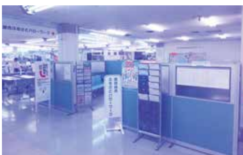
庁舎内ふるさとハローワークの充実を！