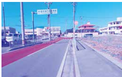
道路形態が正常化した市道10号線

道路課長 ボランティアの方々の協力を得ながら、道路行政が成り立っているのが現状です。今後も市民や市内業者の方々の協力を得ながら、維持管理に努めていきます。