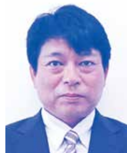
副議長 外間 剛