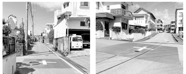
クロス標示が施された市道238号線

経済建設部長 注意喚起として、交差点部分にカラー舗装によるクロス標示を6月中旬に設置予定。