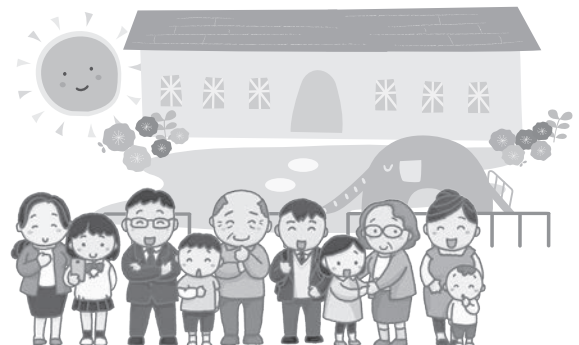
豊見城中学校区にも児童館を！！

福祉健康部長 旧大城医院跡地やIT産業振興センター跡地周辺などで市有地を活用した設置ができないか、検討しているところです。