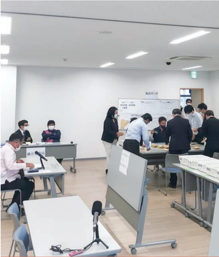
職員アンケート開封、集計作業 (令和4年2月3日)