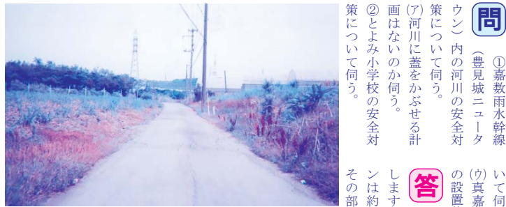
整備が待たれる市道33号線

問 (豊見城ニュータウン)内の河川の安全対策について伺う。 (ア)河川に蓋をかぶせる計画はないのか伺う。 ②とよみ小学校の安全対策について伺う。