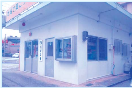
県下最大規模の交番へ