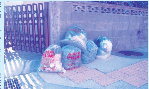
青草はなぜ収集しないのか

答 生活環境課長 ①について、豊見城市自治会清掃活動支援事業により、一般廃棄物は分別すれば糸・豊美化センターに何度でも無料で搬入することが可能であります。それ以外の青草等の処理困難物、産業廃棄物につきましては民間処理施設での処理代、運搬車両リース代、燃料代等として年3万円を補助する制度を設けております。