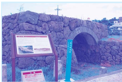
市指定の真玉橋遺構

旧陸軍病院跡地の保全・活用は地権者の協力が得られず話し合われていない。保栄茂グスクのトーチカは自治会の申請がなければ対応しない。シーサーや旧海軍壕、豊見城城趾は自治会及び