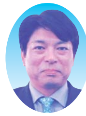
外間 剛 議員