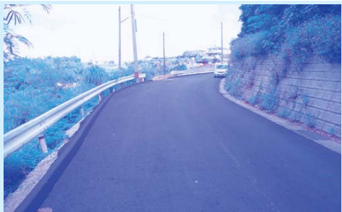
きれいになった市道22号線

市道257号線は、来年4月開校の通学路になる道路です。児童生徒の安全対策は何より優先する課題である。