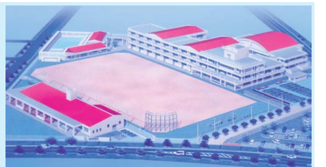
豊崎小・幼稚園の来年開校予定は？