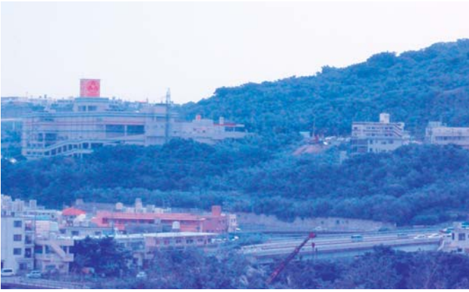
中心市街地代替整備事業地区