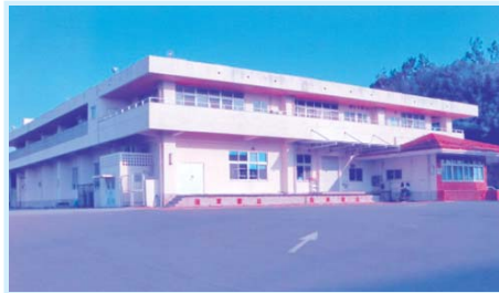
安心・安全な給食が求められています

法第11条に反する ことにならないの ことには、学校給食 理員の給料を払う 請負業者がその調 理員は、学校給食 に規定されたすべ ての義務を負うも のである。しかし、 請負業者がその調 理員の給料を払う ことは、学校給食 法第11条に反する ことにならないの ことには、学校給食 理員の給料を払う 請負業者がその調 理員は、学校給食 に規定されたすべ ての義務を負うも のである。しかし、 請負業者がその調 理員は、学校給食 に規定されたすべ ての義務を負うも のである。しかし、 請負業者がその調