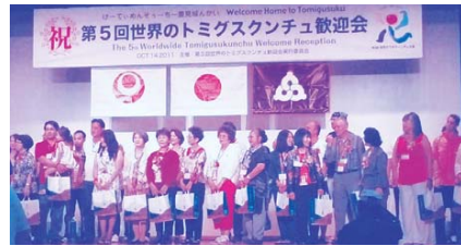
国際交流を進展させましょう

答 企画部長 本市の観光振興計画の必要性は高まっていると認識しており、観光振興計画の策定に向けた取り組み