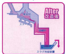
最終処分場の負荷を減らすことにつながるシステム

ため、最終処分場への搬入が飛灰と不燃残渣のみであり、他の2組合とは事業が異なることも視野に、建設負担金等の議論を行うこととなります。いずれにしても、自らがごみは自ら処理の基本理念に則り、南部の廃棄物行政の安定的な運営のため、糸満市と足並み揃え取り組みます。