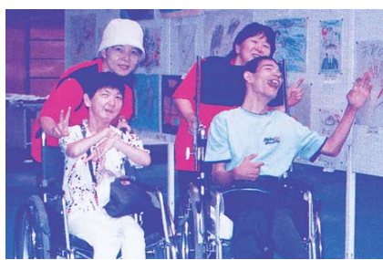
ひとまねではない独自の障がい者支援を

学校教育課 日曜授業参観日に親子での徒歩登校を奨励し、通学路の安全確認、安全指導に