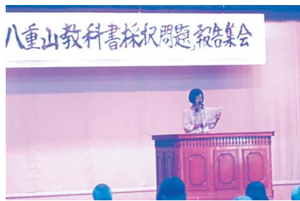
教科書問題那覇集会にて