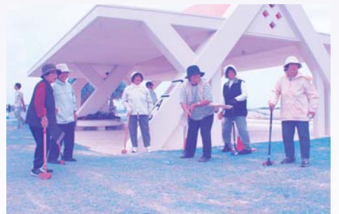
第27回豊見城市農漁業者スポーツ大会(於：豊崎海浜公園多目的広場)