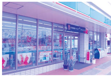
税金等の納付を各コンビニでも

陳情第20号 漁業用燃油にかかる軽油取引税の免除等に関する国への意見書の提出を求める請願書 採 択