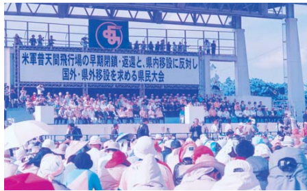
9万人余が集った県民大会に参加(2010年4月25日)於:読谷村

本格的な導入に、積極的に取り組む慎重な議論が必要であると考えるております。②与根漁港内、瀬長船たまり場周辺で国道331号バイパスの工事が行われております。この工事に伴い、与根、瀬長の航路に土砂等が流入することが懸念されるため、国道事務所へ要望書の提出を考えております。