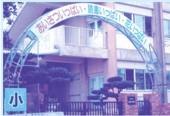
改築が待たれる座安小学校

問 (ア)校舎の改築計画概要を伺う。(イ)学校が災害時に地域の避難場所として使用できるよう、屋上や最上階等に備蓄用品を収納できる場所の確保について見解を伺う。(ウ)市道25号線から迂回路として座安地域へ進入する車輛が増えている