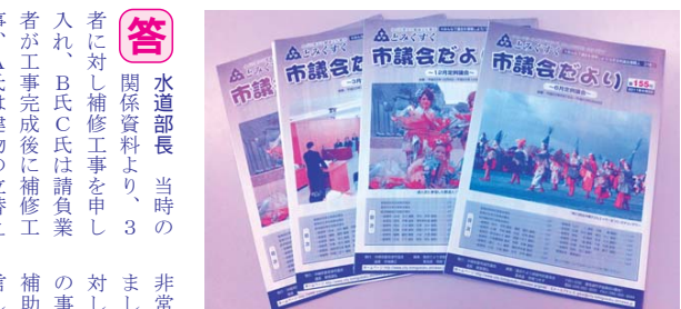
是非、議会の傍聴を！ 詳細はホームページでも閲覧出来ます

問 水道部長 当時の関係資料より、3者に対し補修工事を申し入れ、B氏C氏は請負業者が工事完成後に補修工事、A氏は建物の立替え要求のため補修工事を受け入れてもらえなかった。市の対応の違いはなかったと思っております。補償処理を下水道事業と関係のない別の道路事業で処理をする受け止められるような発言は適切ではなかったと思っております。慣例はございませぬ。当時の長が発言を容認していたか記録がなく