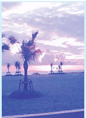
豊見城市の魅力とは何？ 観光協会のミッションは...

答 企画部長 おおむね観光の方向性、考え方はまとまっております。方向に沿って体験プログラム、ハリー大会とか、市をアピールできるイベントが増えてきた。そして人を集める施設も充実してきた。今後は素材をどうアピールし、磨いていくのか問われている豊見城の観光とはやはり地域の素材、観光資源、地域資源を活用し、地域コミュニティを活性化させる。その中で、それを見よその人が来るものであるべきだと考えております。