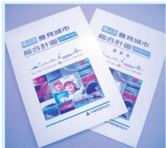
まちづくりの指針として活用を図ろう

まちづくりの指針として活用を図ろう 向けた第一歩 になります。 また、人と人が触れ合い、 地域がつながり、 みんなで支え合うまちづくりに向けて、 新たな、新たな 推進課を設置 に協働のま