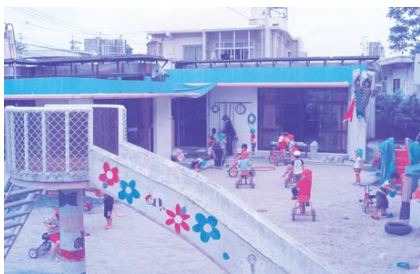
上田保育所の耐震度調査を