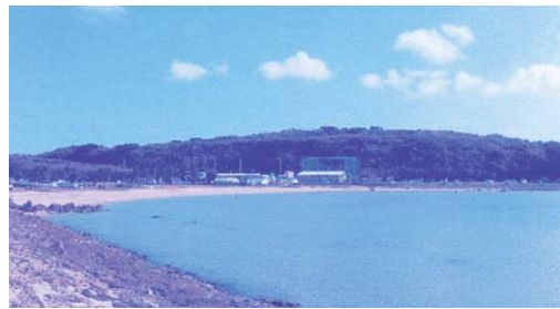
有効活用が期待される瀬長島

生涯学習振興課長 両施設は現在、指定管理者制度を導入しておりますので、指定管理者と調整協議を行い、企業広告等を募り広告収入を利用して施設利用者の利便性を主に考えた施設整備等が行えるよう協力していきたく考えております。そのために他市町村や他県の状況等、調査研究していきたいと考えております。