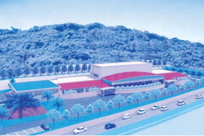
南斎場完成予想図