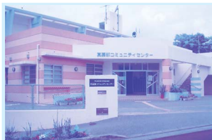
夜間、日曜日も開館、市民の活用が望めます