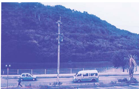
琉球王国時代、首里城を起点とした真珠道が通っていた

城址公園周辺整備について 石火矢橋から火葬場、豊見城高層住宅へ抜けるアクセス道路があれば生活の利便性が向上されると思われま