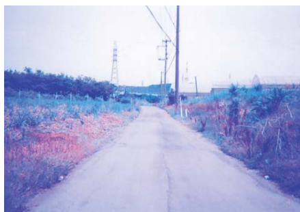
整備が待たれる市道33号線

で、金額はどの程度になるか。 振興開発課長 あくまで概算ですが、約26億円となっております。その他の質問 ・補助金不適正使用、返還問題の全容を明確に。 ・放課後児童健全育成事業の充実について。 ・真玉橋田地地域の急傾斜地崩壊対策事業。 ・消防広域化について。 ・環境行政について。