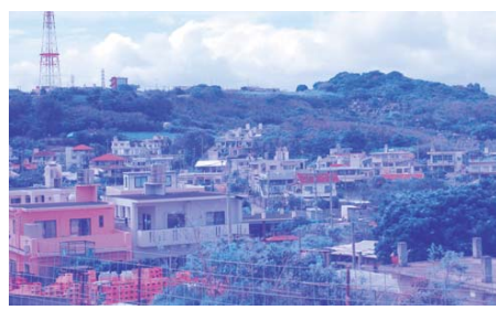
下水道整備の必要な金良・長堂地域

③市道38号線についてですが、舗装工事を発注してございます。3月末までには、完成する予定となっております。