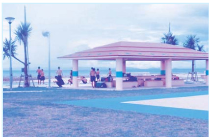
事務費の一部返還命令が出た豊崎関連事業