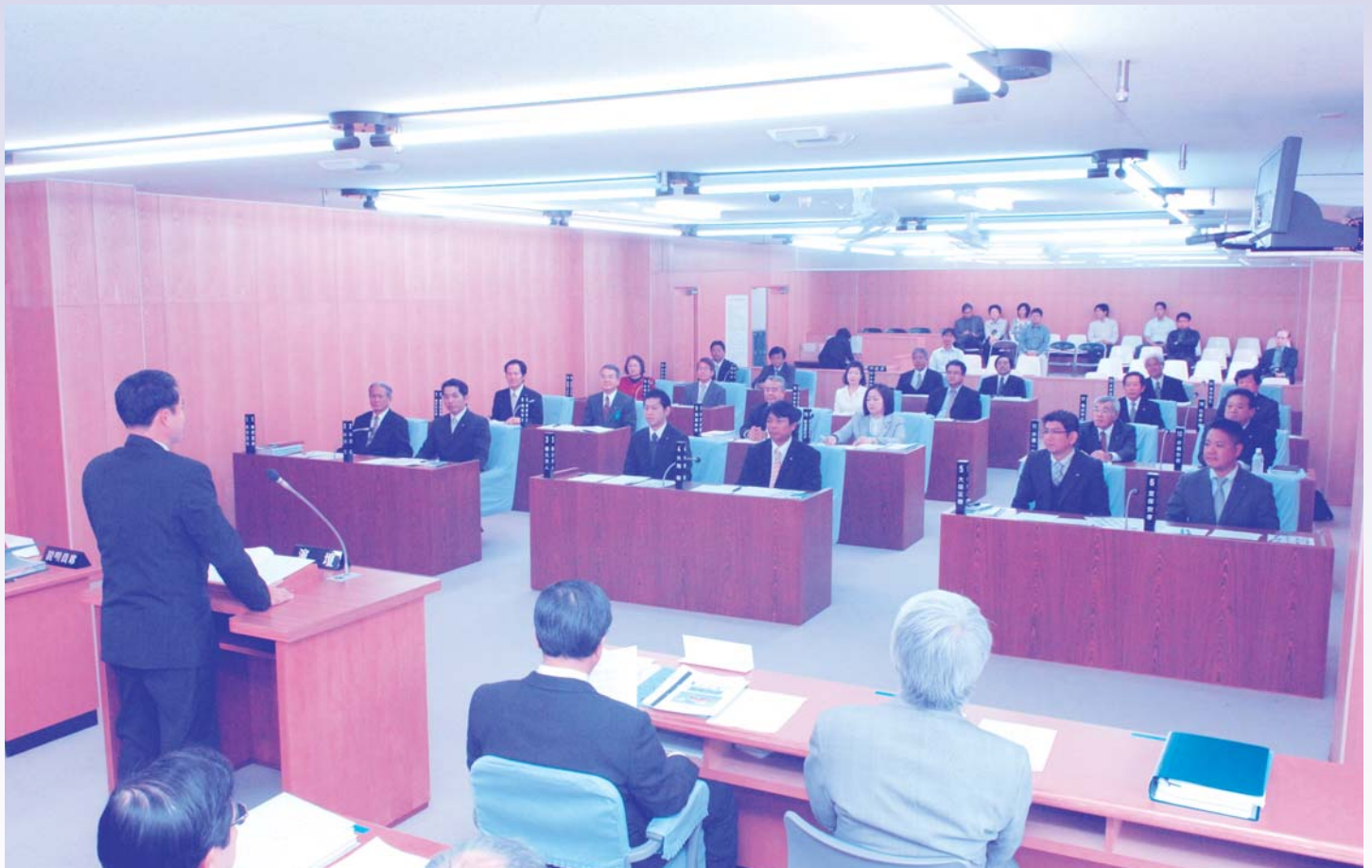
第18期議員、当選後の初議会