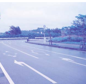
豊崎小の通学路を整備しよう

問 高齢者・障害者のための投票率アップ対策を 補助員を確保して、事前に投票場まで行くための手段を考えていただきたいが、どう考えるか。