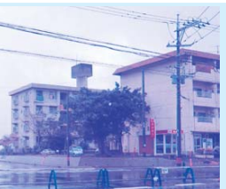
供用開始が間近な市道40号線