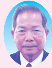
議長 屋良 国弘