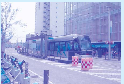
評価の高い富山市内を走るLRT

市長 ③年度中にシンポジウム、フォーラム等を開催し、市民の気運を高める必要があると思っております。