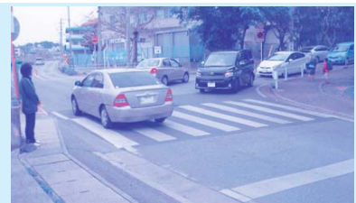
通学路の安全確保を