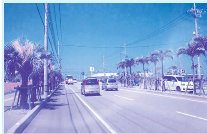
会計検査院から、国庫補助事業の違法支出を指摘された豊崎地区

平成15年度から平成20年度までの6ヵ年分の事務費の正確な総額と違法支出額並びに加算金の正確な総額を明らかにして頂きたい。