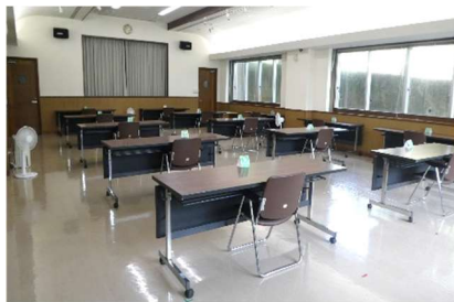
1階大集会室を学習室として開放