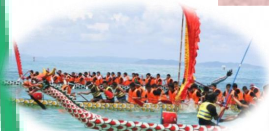
ハーリーの発祥の地「豊見城」

おきなわ工芸の杜 OKINAWA CRAFT INDUSTRY PROMOTION CENTER