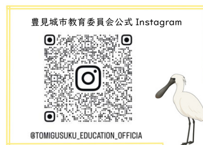
市の鳥 クロツラヘラサギ

どのこどもも未来に希望を描き、一歩を踏み出せる環境づくりは、まさに学校の授業から始まります。本市の教育目標である『「ゆめ」「まなび」「ひと」が響くまちの教育』の実現を胸に、豊見城市教育委員会は、より豊かな学びの未来を見据えた学校教育ビジョンをここに掲げます。