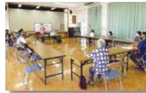
▲豊見城団地自治会（6月27日）

多くの地域の方にご参加いただき、ありがとうございました。 各地域の懇談会の様子をご紹介します。