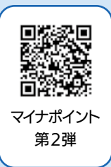
マイナポイント 第2弾

▶マイナポイントのことならマイナンバー総合フリーダイヤルまで ☎0120-95-0178(ダイヤルの「5番」選択)