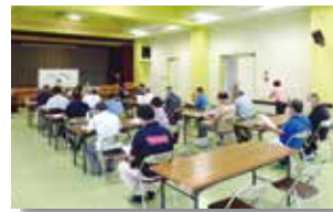
▲根差部自治会（7月5日）