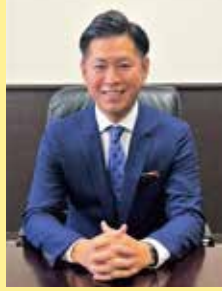
豊見城市長 徳元 次人