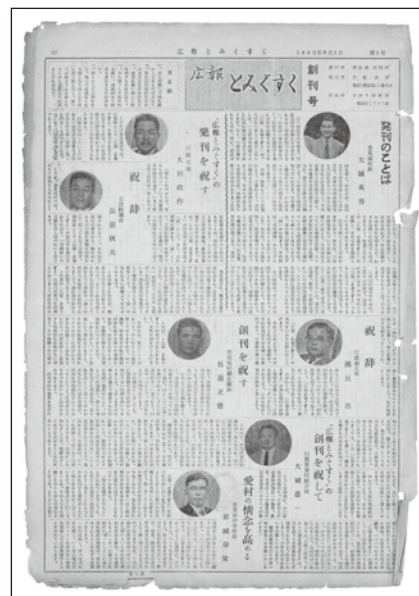
▲1962年(昭和37年)_8.1_第1号(創刊)