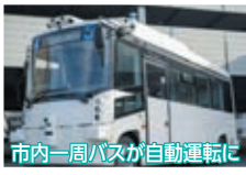
市内一周バスが自動運転に