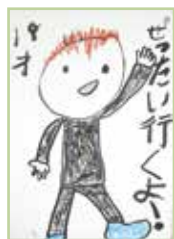
令和5年度(小学生の部)優秀賞作品