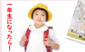
一年生になったら!