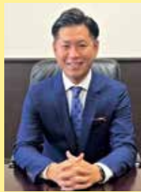
豊見城市長 徳元 次人