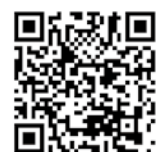
学生納付 特例制度