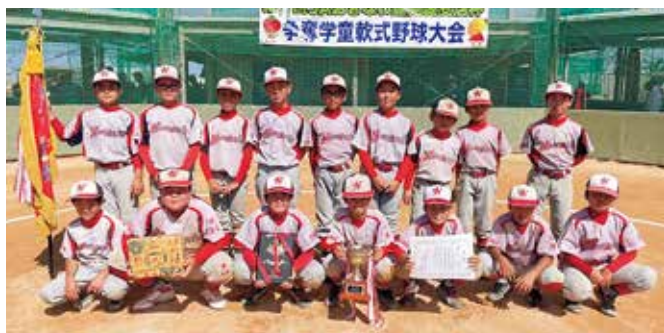
【JAおきなわ豊見城支店杯】