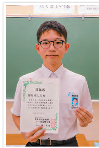
▲防災士認証状と防災士証

「大切な家族や友人を守れるように、災害の危険性や防災の大切さを啓発し、その輪を広げ豊見城市を日本一安全なまちにしたいです。また、防災士を取得後、共助に必要な地域住民のつながりの大切さに改めて気づいたので、将来、僕自身がそのつながりをより深めることができると考えています。」