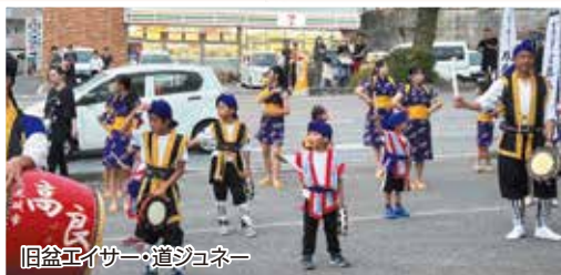
旧盆エイサー・道ジュネー