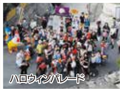
ハロウィンパレード