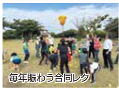
毎年賑わう合同レク