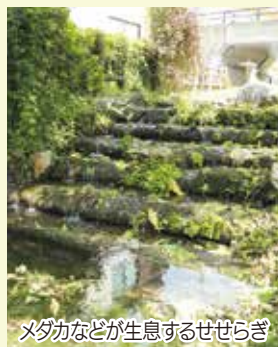
メダカなどが生息するせせらぎ