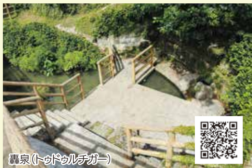
轟泉(トウドウルチガー)