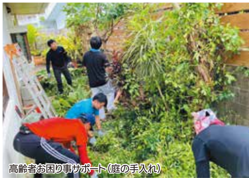
高齢者お困り事サポート(庭の手入れ)