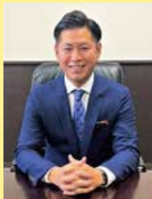
豊見城市長 徳元 次人