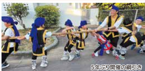
5年ぶり開催の綱引き

自治会に加入して地域の繋がりを広げよう!自治会はお互いを見守り、助け合い、楽しい居場所を目指しています! 協働のまち推進課 ㊦850-0159