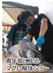
青年部による マジックショー

また、夏祭り等の大きな地域行事は自治会員だけで企画運営せず、近隣の皆さまのご協力や積極的なキッチンカーの誘致などで省力化を図り、子どもから高齢者まで、地域の皆さまがゆつくりとイベントを楽しんでいただくスタイルで運営しています。