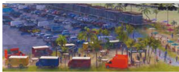
▲事業のイメージ図