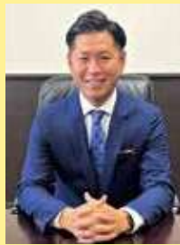
豊見城市長 徳元 次人