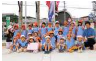
こいのぼり掲揚式