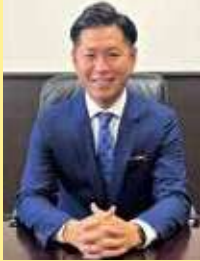
豊見城市長 徳元 次人