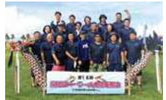
第16回豊見城ハーリー大会