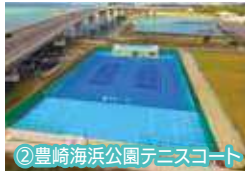
②豊崎海浜公園テニスコート