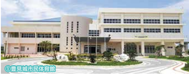
①豊見城市民体育館

本市が所有する施設を有効に活用し、新たな財源確保および市民サービスの維持・向上に寄与することを目的として、豊見城市公園施設への愛称を命名する権利(ネーミングライツ)について、下記のとおりパートナー企業を募集します。