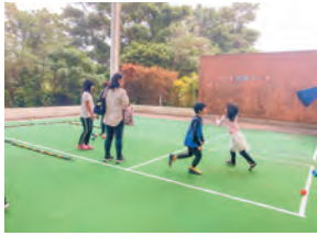
生涯スポーツ体験