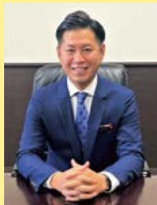
豊見城市長 徳元 次人