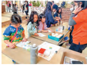
スライムづくり体験