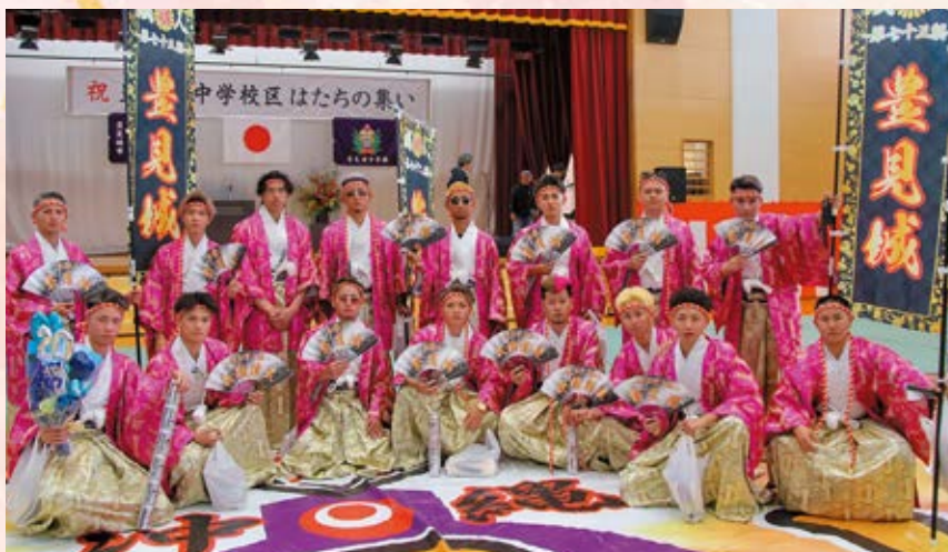
表紙:P2-3 はたちの集い 関連