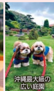
沖縄最大級の 広い庭園