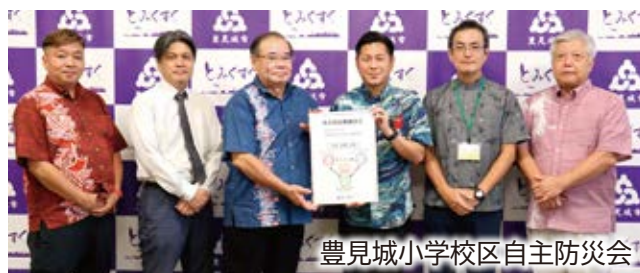
豊見城小学校校区自主防災会