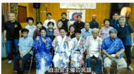
自治会主催の民謡

渡橋名自治会は座安小学校の近くにあり、前から上級学校への入学者が多いといわれていました。渡橋名には字の歌があり、公民館舞台の中央に展示され区民発展の希望を表しています。 年間行事の新年会や親睦会、こども園との交流会などでは、踊りや歌、民謡が披露され、伝統の綱引きの際は、女性部会の料理やぜんざいなどが振る舞われ、地域の方々が垣根なく触れ合える交流の場となっています。 また、健康づくりのために毎週月曜日にはミニデイ(ブーゲンビリアの会)で健康体操やゲームを楽しんでおり、夏休みには親子で参加できるラジオ体操を行っています。 自治会では環境整備にも取り組んでおり、住みよい地域づくりのため草刈り作業を行っています。特に女性部会は、毎月第一日曜日に公民館周辺の環境美化活動を実施しており、年中花壇がきれいに保たれています。 これからも、地域に根ざした自治会を目指し、活動に励んでまいります。