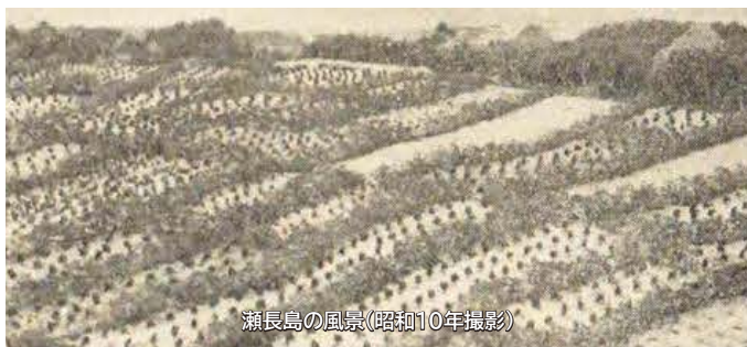
瀬長島の風景(昭和10年撮影)

今や豊見城市の一大観光地として発展を遂げている瀬長島。太古の時代、琉球の国を創った神々アマミキヨの一族が最初にこの島に住み、そこから豊見城の歴史が始まったという発祥伝説をご存知の方も少なくないかと思います。特に私が興味深いのは瀬長島近代史です。過去の瀬長島は首里の王族である豊見城御殿の所有地であり、島の住民は旧藩時代から借地として小作をして生活していたそうです。