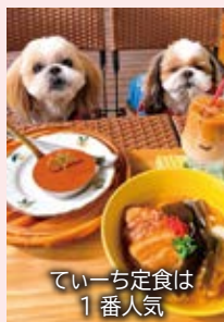
ていーち定食は 1 番人気