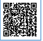
図 予防課 ☎850-3105

住宅用火災警報器は、古くなると、電子部品の寿命や電池切れなどで火災を検知しない場合があります。10年経ったら機器本体を交換しましょう。