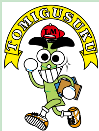
マスコットキャラ トムくん