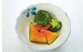
▲かぼちゃとブロッコリーの蒸し焼き