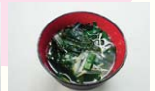
▲具だくさんのすまし汁