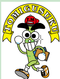
マスコットキャラ トムくん