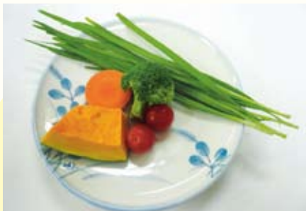
▲緑黄色野菜:120グラム