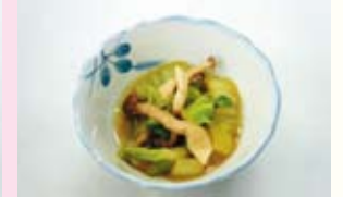
▲白菜としめじの煮浸し