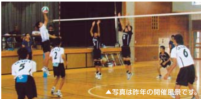
▲写真は昨年の開催風景です。