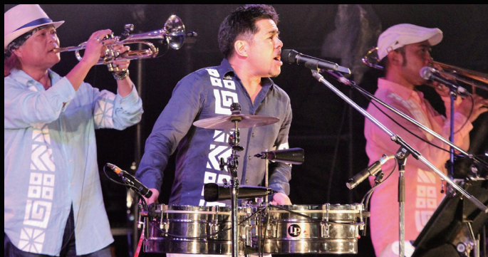
▲2日目、ライブのフィナーレで登場! デイアマンテス