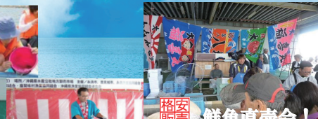
格安販売 鮮魚直売会!