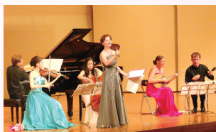
▲2014年のコンサート風景

日時 9月30日(金) 開場 18時30分 場所 市立中央公民館 入場料 無料 (要入場整理券)