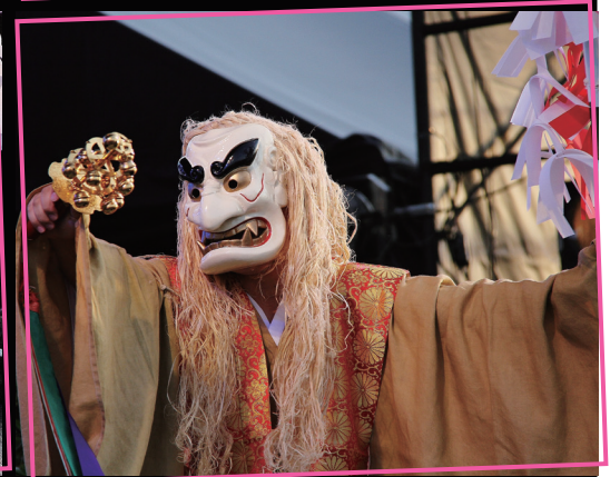
▲国の重要無形民俗文化財に指定されている宮崎県高千穂町の『高千穂の夜神楽』