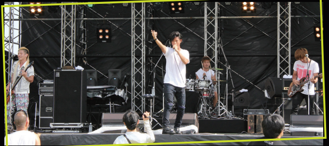
▲市観光大使シベリアンスカンクによるライブ