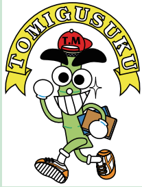
マスコットキャラ トムくん