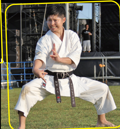
▲空手の形を披露する剛柔流仲本塾生