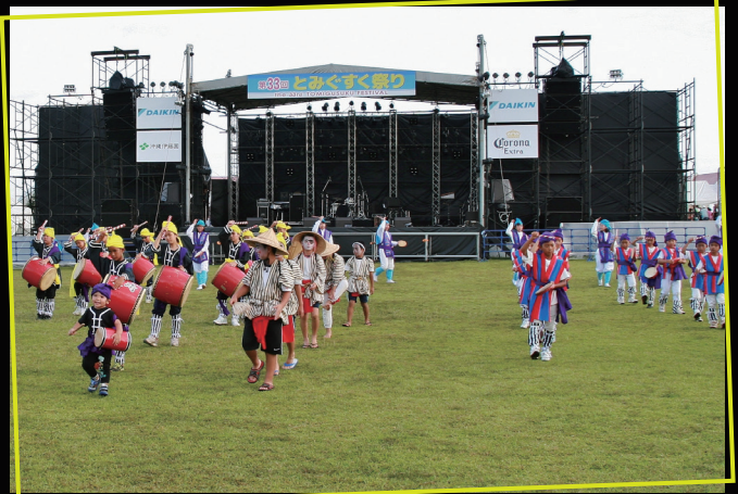
▲第 28 回全沖縄子どもエイサーの様子