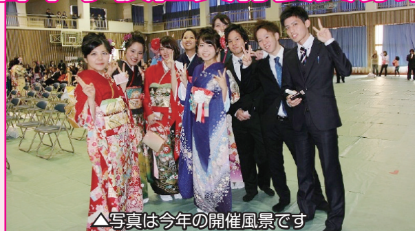
△写真は今年の開催風景です