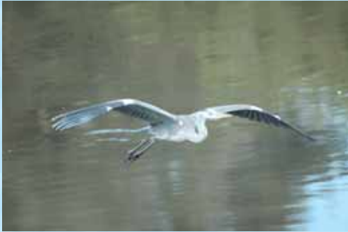
▲水面上を飛ぶ!?泳ぐ!?アオサギ

水泳選手を鳥に例えてみよう(ごめんなさい)。彼等(鳥)は、水中(空中)をスツと潜った(泳ぐ)かと思う