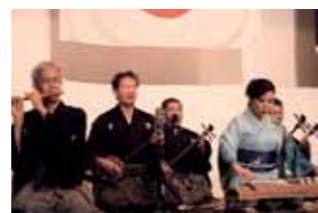
▲ 市文化協会の合奏により祝賀会が幕開け。