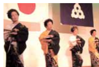
▲ 真玉橋自治会が日舞「春が来た」を披露。