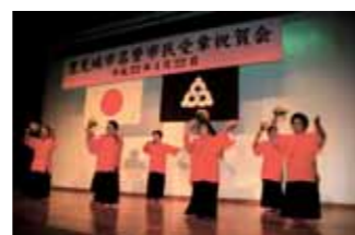
▲ 「祝い節」を披露した高安自治会。