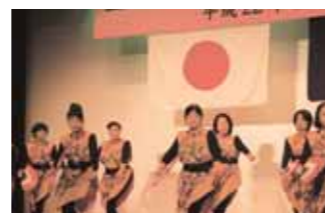
▲ 与根自治会による余興「あやかり節」。