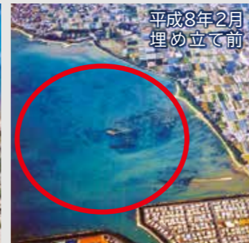
平成8年2月埋め立て前