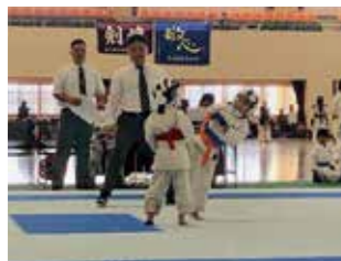
▲空手道組手競技の様子