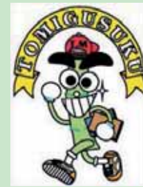
マスコットキャラ トムくん