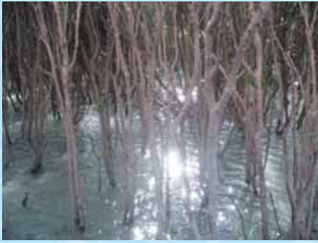
▲木道から見るメヒルギ

突然、濡すじの水面に波の輪が広がった。振り返ってみると、カワセミが何やら口にくわえて、さっと飛んでいった。朝の