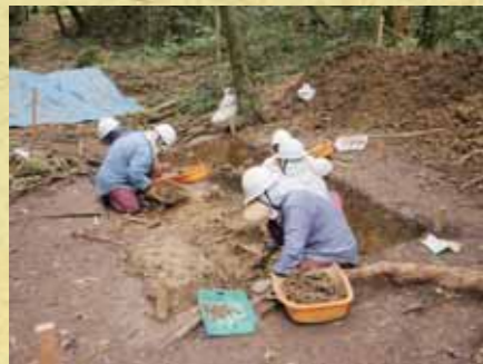
▲保栄茂古島遺跡確認調査風景