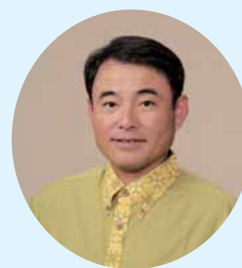
市長に当選した宜保晴毅氏