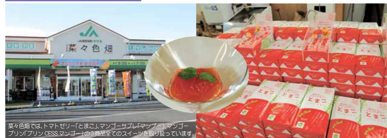
菜々色畑では、トマトゼリー「とまご」、マンゴーサブレ「マンブー」、マンゴープリン「プリンCESSマンゴー」の3商品全てのスイーツを取り扱っています。

豊見城産のトマトと古酒がマッチした“大人の味” 県内60%の生産量を占める豊見城産トマトをゼリーでいただく。トマト好きには堪らない新たな食感。豊見城で育ったトマトに泡盛と県産シークワーサーを加えたちよっと大人の味。泡盛もこれまた豊見城生まれの忠孝酒造の古酒を使用といったこだわり。保存料を使用しないかわりに、古酒が独特の風味と日持ちのするスイーツを生み出す重要な役割を果たします。 ゼリーとしては珍しく紙パックに個別包装されており、スプーン無しでそのまま食することができるのも魅力。地元生まれですが完全自動機械生産で人間の手が入らないため衛生面においても安心・安全です。 「トマトゼリー」と「マンゴー」を主に販売している道の駅「豊崎」内にあるとよさき菜々色畑では、1カ月に約400箱売れているといます。1箱8個入りで¥900。大人の味を堪能してみてください。