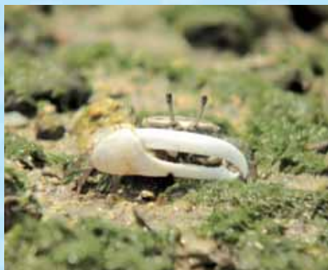
▲オキナワハクセンシオマネキ

分からないが、チャーヒンギ(逃げ回る)。すると、近くのマングローブの林の中で、子どもたちが、チャーチャーと言っていて、何だか言い直しのよくな話が聞こえてきた。