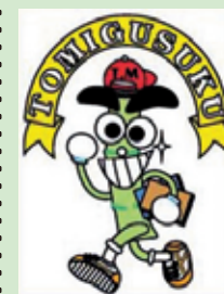
マスコットキャラ トムくん