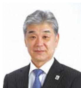
姉妹都市 高知県土佐清水市長