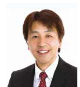
姉妹都市 宮崎県高千穂町長