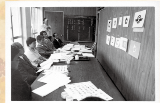
▲1976年3月27日の審査会議の様子

この時公募されたデザインは、他にどのようなものがあったのでしょうか。一次選考を経て残った32点のデザイン審査会議の写真にその一部を見ることが出来ます。 文化課が所蔵する村章制定時の資料の中にある応募者の意匠意図をみると、「豊見城の【と】の字を鳩と波に図案化し、平和と団結、飛躍を表現した」、「豊見城の【と】を図案化し、6枚の翼は村の飛躍、円