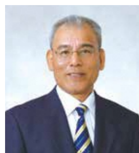
姉妹都市 宮崎県美郷町長