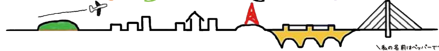
私の名前はペッパーです!