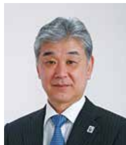
姉妹都市 高知県土佐清水市長 ひじや みつのぶ 泥谷 光信