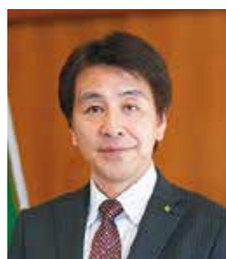
姉妹都市 宮崎県高千穂町長 かいむねゆき 甲斐 宗之