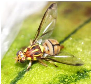
セグロウリミバエ成虫