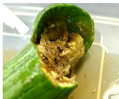
加害されたヘチマ