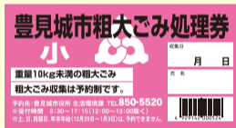
《粗大ごみ処理券(小)》

年々増え続けるごみの減量化・資源化を目的に、「資源ごみ」「危険ごみ」を加えて指定袋による5種類分別で収集します。