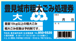
《粗大ごみ処理券(大)》